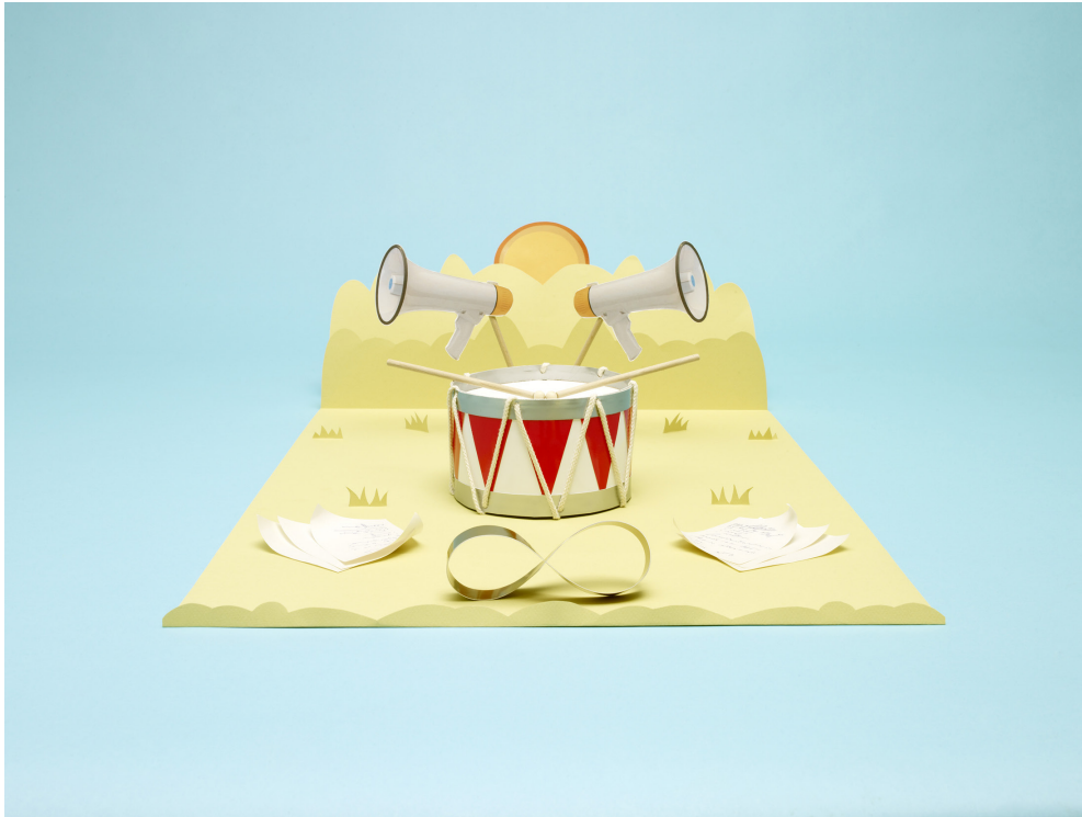
KREATIVGESELLSCHAFT Styling- und Setdesign