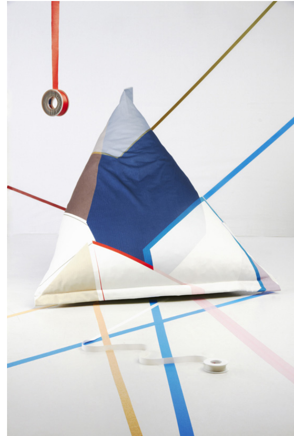
TUCH UND SITZSACK Produkt- und Setdesign