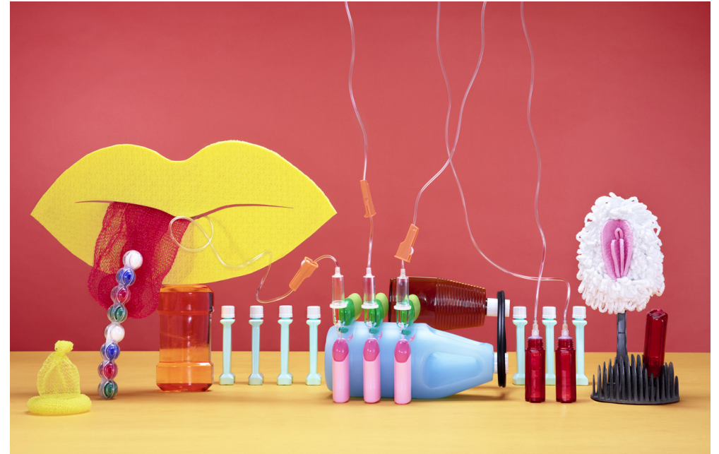
CLEANSEX Styling- und Setdesign