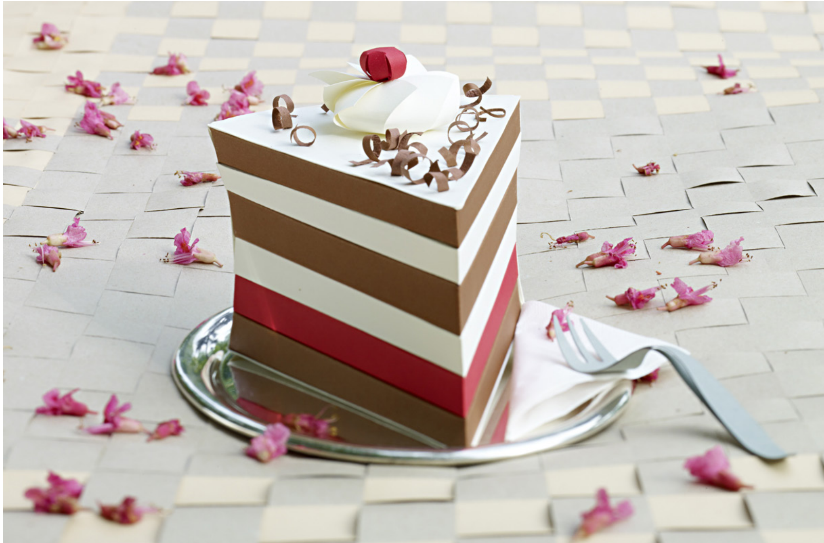
TORTE Produkt-und Setdesign