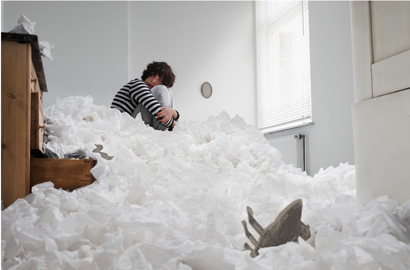
ZEIT WISSEN RATGEBER PSYCHOLOGIE Styling-und Setdesign