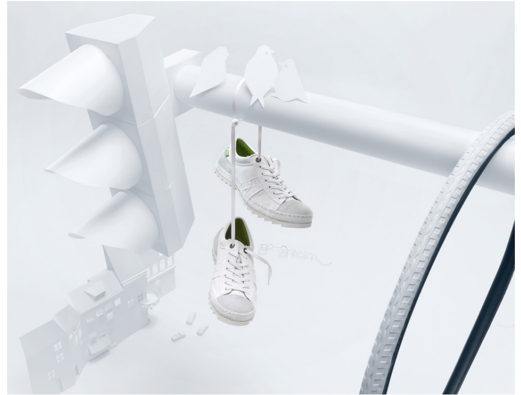
IMAGE CAMPAIGN SNIPE FRÜHJAHR/SOMMER 2011 Setdesign- und Styling