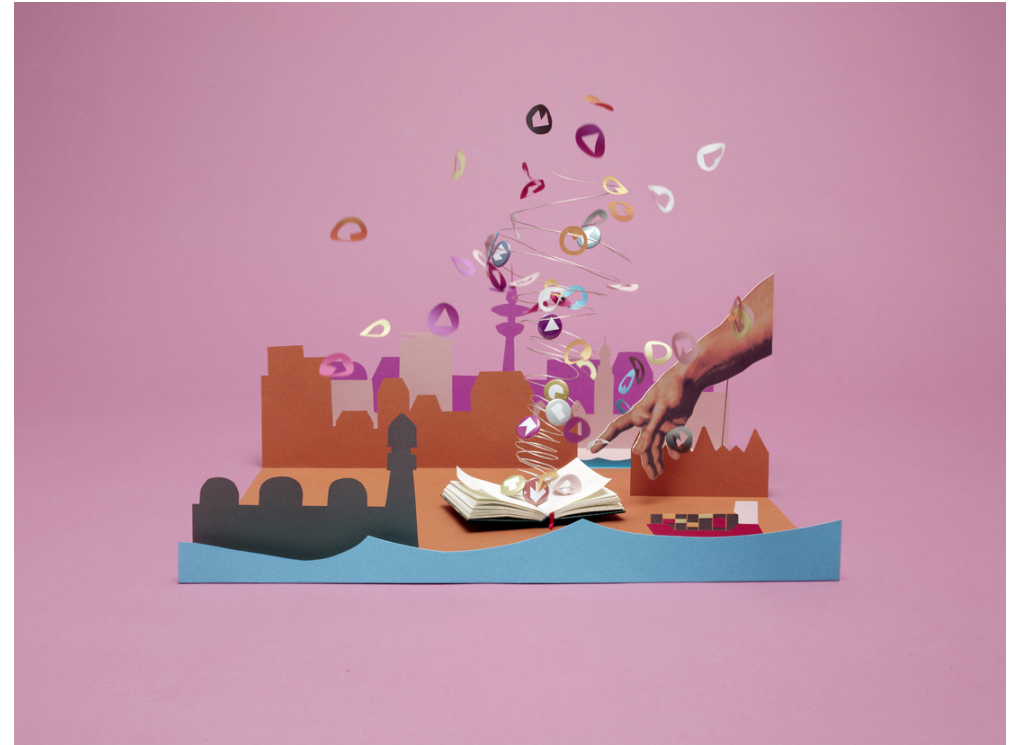
KREATIVWIRTSCHAFT Styling- und Setdesign