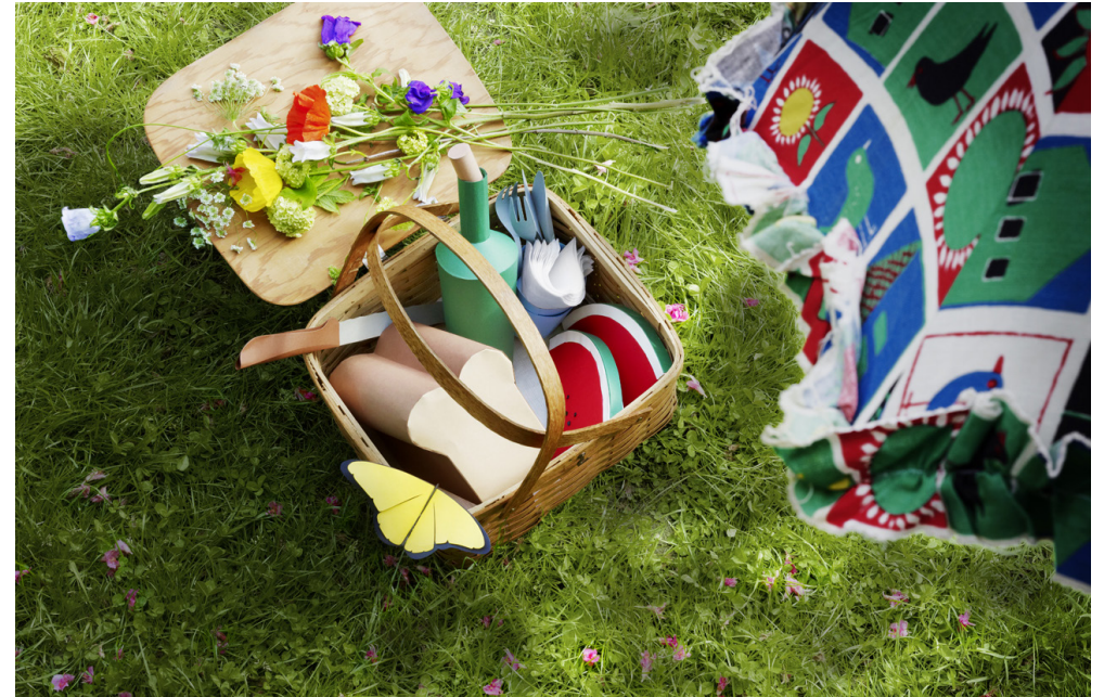
PICKNICK Produkt-und Setdesign